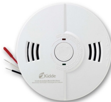
Devant de l'avertisseur et fils

Dans certaines circonstances, l'avertisseur cesse de produire le son qui indique que l'appareil a atteint la fin de sa durée de vie (après sept ans), ce qui peut amener le consommateur à croire que l'avertisseur fonctionne toujours.